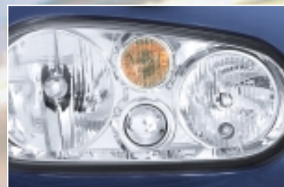
Diseño antiguo: Lámpara convencional con recubrimiento ámbar.