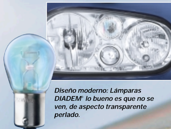
Diseño moderno: Lámparas DIADEM® lo bueno es que no se ven, de aspecto transparente perlado.

La lámpara de diseño DIADEM® es a prueba de rayones y libre de cadmio. Esta lámpara resulta ideal para todos los faros, ya sea delanteros como traseros. Puede usarse como repuesto de cualquier lámpara ámbar y lo que es más, dura el doble que las lámparas ámbar recubiertas convencionales.